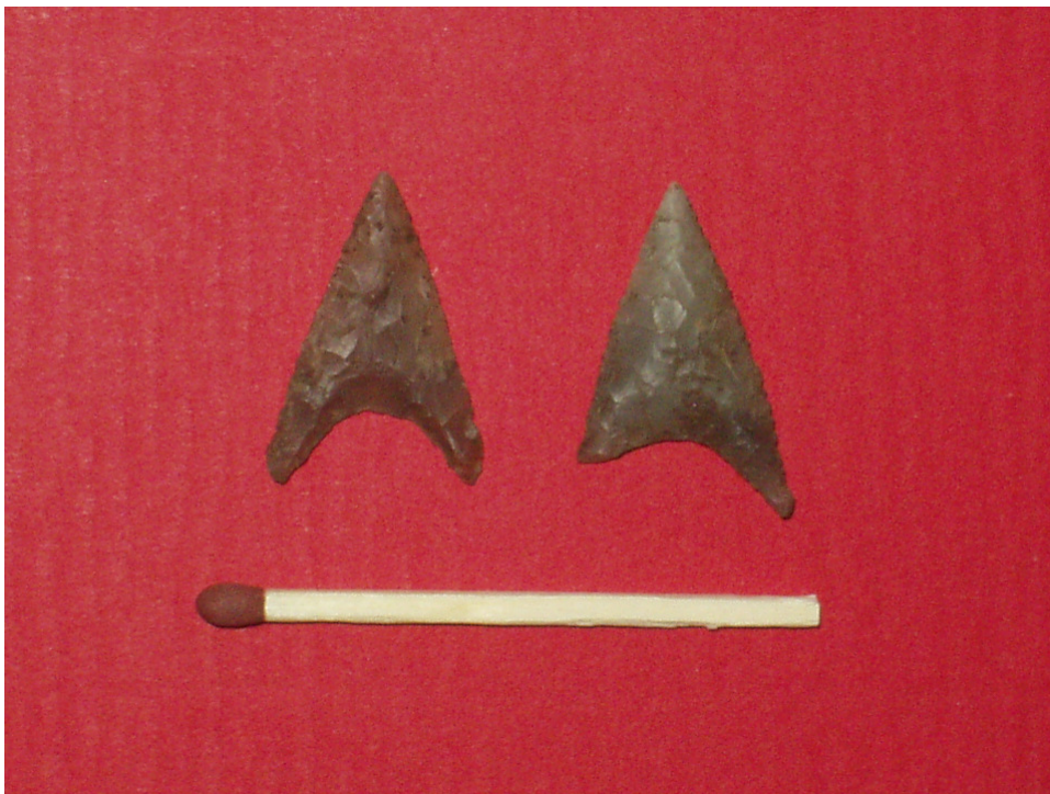
Pilespidser fra centralgraven i gravhøjen på VMÅ 2450. De er fladehugget – en teknik, hvor flere hundrede meget små, fine "skæl" presses af flinten med en trykstok af f.eks. hjortetak.

På VMÅ 2450 blev der udgravet en meget nedpløjet gravhøj. Der var kun et ganske tyndt lag på ca. 40 cm tilbage af selve højfylden, men det var alligevel muligt at finde den centrale grav i højen. Højen var bygget i to faser, det betyder, at man på et tidspunkt har valgt at udbygge den oprindelige gravhøj. Udbygningen er sandsynligvis sket i forbindelse med, at man har foretaget yderligere en begravelse i højen. Men det var ikke muligt at finde andre grave end den oprindelige centralgrav pga. den kraftige nedpløjning af højen. Den oprindelige gravhøj havde en diameter på ca. 14 m. Ved foden af højen var der anlagt et 1-1,5 m bredt stentæppe som afslutning på højen. Siden hen er højen blevet udvidet til en diameter på ca. 20 m. Hvornår dette er sket vides ikke, men det er muligt at det er sket samtidigt med anlæggelsen af kult anlægget i den sidste halvdel af bronzealderen. Det kan dog også lige så vel være sket på et tidligere tidspunkt. Ved foden af den udvidede høj var der sat en randstenskæde af store sten, og udenfor denne var der gravet en lav smal grøft. I den oprindeligt byggede høj blev der som nævnt fundet en grav. Graven var 2,9 m lang og 1,8 m bred. Graven var meget forstyrret, og den må være blevet plyndret. Hvornår plyndringen har fundet sted, er det ikke muligt at udtale sig om. Det kan lige såvel være i oldtiden som i nyere tid. I den sydlige del af graven var der et uforstyrret parti. Her blev der fundet to fladehuggede pilespidser af flint.