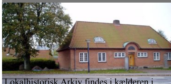
Lokalhistorisk Arkiv findes i kælderen i 1935 bygningen.