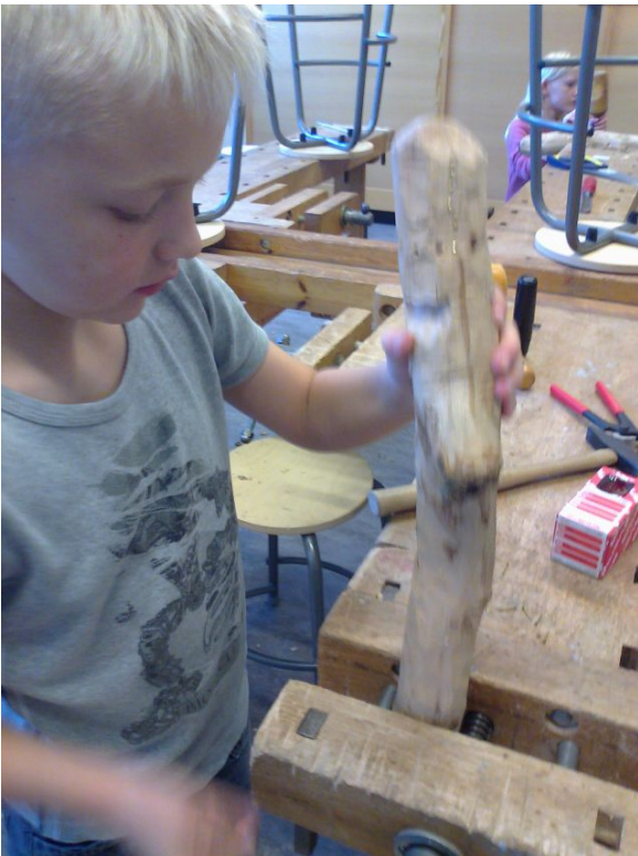
Nu er det træets tur til lidt bearbejdning -med fuld koncentration

Det er oplagt, at vi byder ind med viden, udstyr og mandskab som supplement til den undervisning, der allerede foregår ude på skolerne, og det vil passe fint ind i den igangværende reform af Folkeskolen.