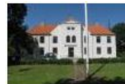
Ting- og Arrest- huset i Løgstør