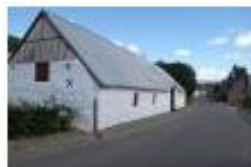
Vesterbølle, beva- ringsværdig lands- by