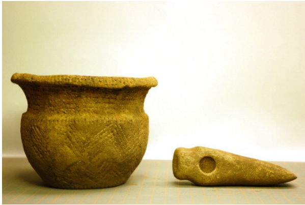
Bæger og stridsøkse fra enkeltgravskulturen fundet mellem Gatten og Flejsborg

Som man kunne læse i sidste nummer af medlemsbladet (nr. 2 2012), har de arkæologiske undersøgelser i forbindelse med Skagerrak 4-tracéet budt på adskillige spændende fund. Undersøgelserne har på den måde bekræftet, at Vesthimmerland er et ganske særligt område, hvor antallet af fortidsminder er betydeligt. I alt er der afdækket 37 lokaliteter, hvor langt de fleste skal undersøges nærmere. Undersøgelserne skal være afsluttet i løbet af foråret 2013, hvor Energinet.dk påbegynder selve kabelnedlægningen. Arkæologerne må derfor trods vind og vejr, hvis de skal nå at blive færdige til tiden.