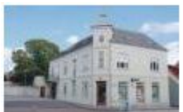
Stationsbyarkitek- tur, Aars