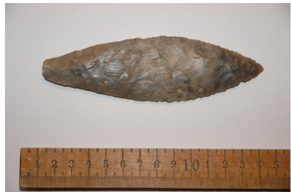
Fladhugget flintdolk fra et af stenkamrene

I løbet af stenalderens allersidste år hundreder er stenkamrene blevet genbrugt, og måske også ombygget. I et af stenkamrene blev der nemlig fundet en fladhugget flintdolk, som skal dateres til denne sidste del af stenalderen. Rundt om kammeret var der anlagt en stenpakning af en type, man ofte ser ved senneolitiske ombygninger af gamle megalit anlæg. Stenpakningen kan tolkes som en barrikadering af gravkammeret, som har skullet forhindre fremtidige genbegravelse, eller måske forhindre den gravlagte i at gå igen?