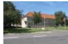
Ranum Statssemi- narium