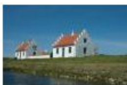
Frederik VII Kanal

”10 Steder med Sjæl” - bygningskulturarv og kulturmiljøer