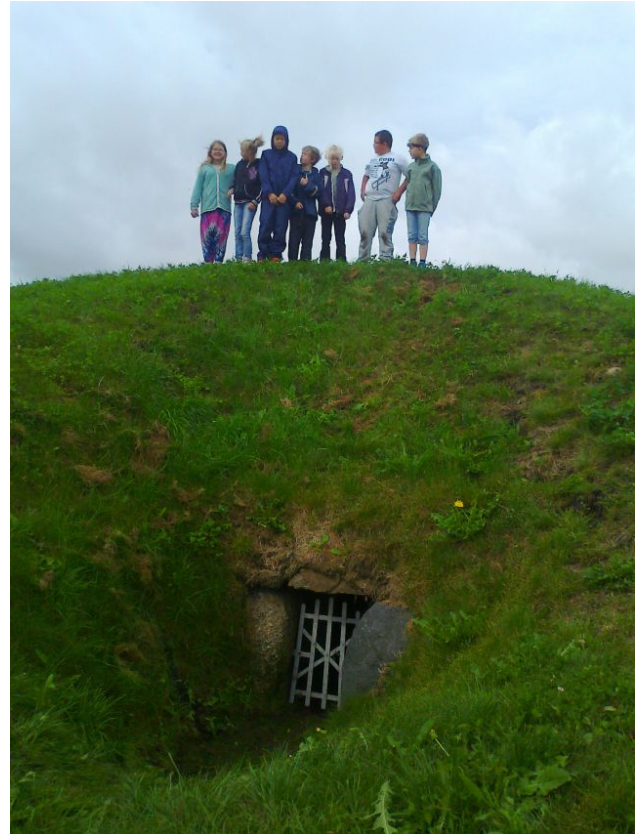
Besøg på Giver Jættestuen

seets lokaler, men også i den grad reagerer så positivt i undervisningen. Derfor søsætter museet et udviklingsforløb rettet mod disse børn, der gerne skulle resultere i tanker og forløb, der kan bruges andre steder.