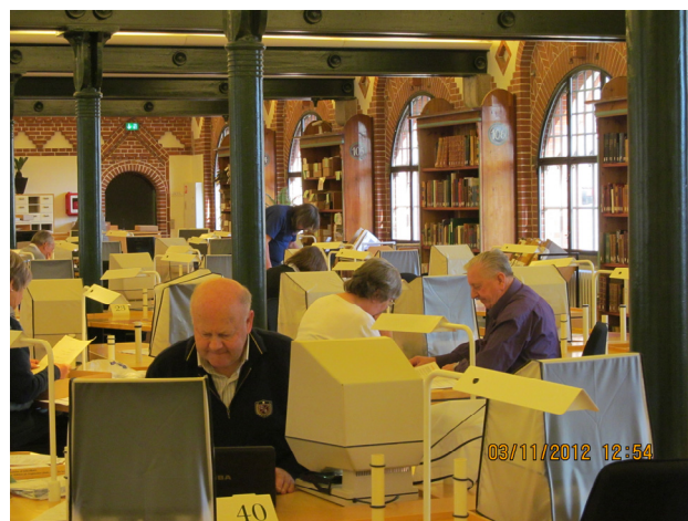
Besøg på arkivet 2012

Farsø Skole, indgang fra Skolegade. Emne: Hvad kan vi som slægtsforskere finde på lokalarkiverne.