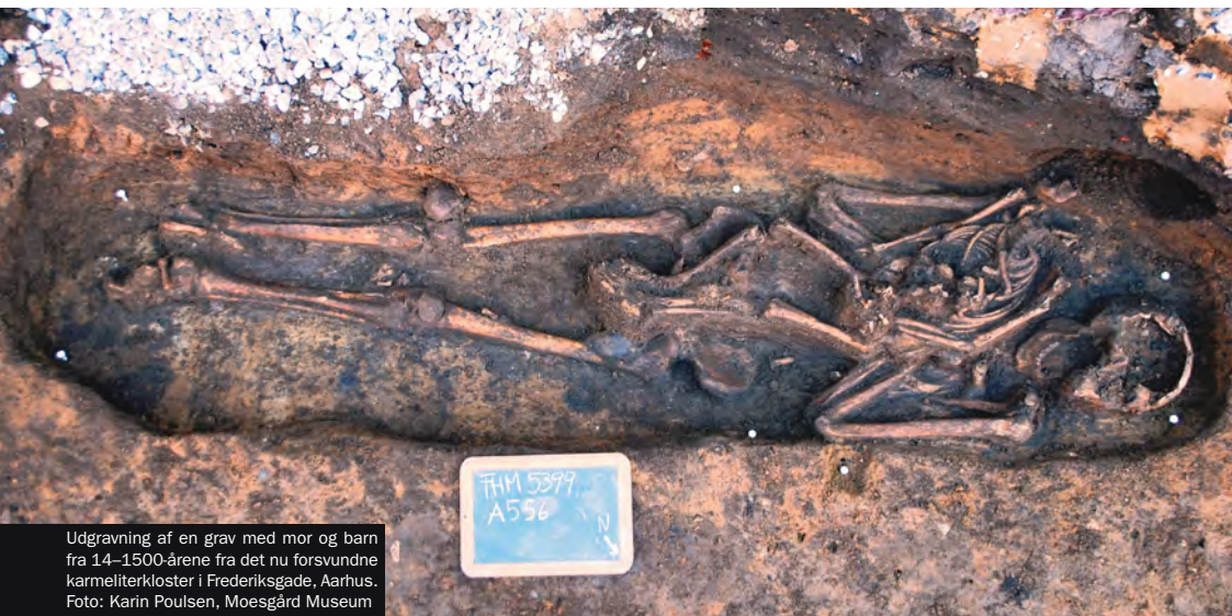
Udgravning af en grav med mor og barn fra 14–1500-årene fra det nu forsvundne karmeliterkloster i Frederiksgade, Aarhus.

I Danmark er arkæologien stort set den eneste kilde til vor viden om alt fra de ældste jægere, der kom hertil for ca. 14.000 år siden, og frem til vikingetidens bønder og krigere omkring år 1000 e.Kr. Herefter kommer de skriftlige kilder til hjælp og går hånd i hånd med arkæologien, når historien om middelalderen, renæssancen og den nyere tid skal fortælles.