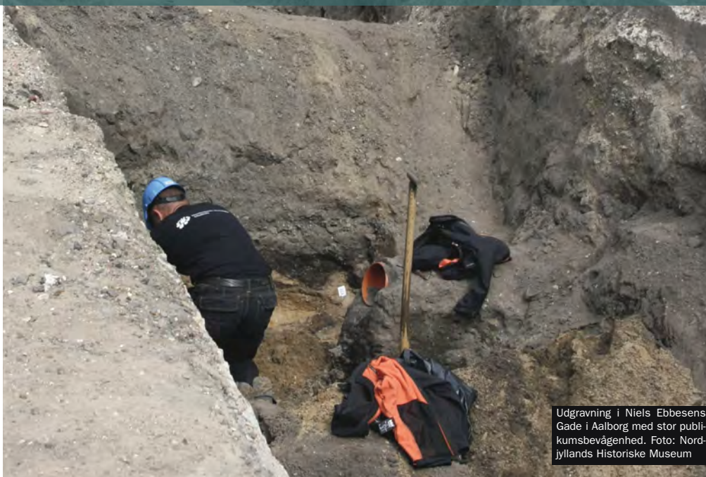
Udgravning i Niels Ebbesens Gade i Aalborg med stor publikumsbevågenhed.

Museerne kan hjælpe bygherre med at revurdere og omlægge anlægsprojektets dele, så man undgår at forstyrre fortidsminderne – og samtidig sparer på udgiften til de arkæologiske undersøgelser.