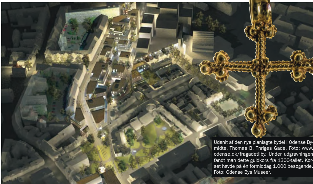
Udsnit af den nye planlagte bydel i Odense By-midte, Thomas B. Thriges Gade. Foto: www.odense.dk/fragadetilby . Under udgravningen fandt man dette guld Kors fra 1300-tallet. Korset havde på én formiddag 1.000 besøgende. Foto: Odense Bys Museer.

I forbindelse med undersøgelserne udførte Odense Bys Museer efter aftale med byherre løbende en lang række formidlingstiltag af den nye viden, der fremkom under udgravningerne. Museet arrangerede bl.a. rundvisninger i udgravningerne og udstillede 'dagens fund' ved byggepladsen. Formidlingen af arkæologien fungerede tillige som springbræt til formidling af planerne for hele byfornyelsesprojektet. På denne vis gav den arkæologiske formidling kommunen en enestående mulighed for at få byens borgere i tale.