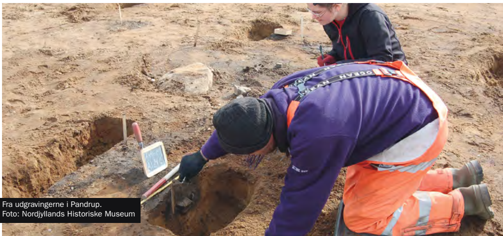
Fra udgravningerne i Pandrup.