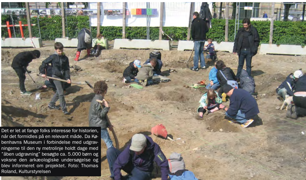
Det er let at fange folks interesse for historien, når det formidles på en relevant måde. Da Københavns Museum i forbindelse med udgravningerne til den ny metrolinje holdt dage med "åben udgravning" besøgte ca. 5.000 børn og voksne den arkæologiske undersøgelse og blev informeret om projektet.

I det følgende beskriver vi et par eksempler på virksom formidling i forbindelse med et byggeri. Du kan finde mere inspiration til værdiskabende tiltag på www.kulturarvsomvaerdi.dk .