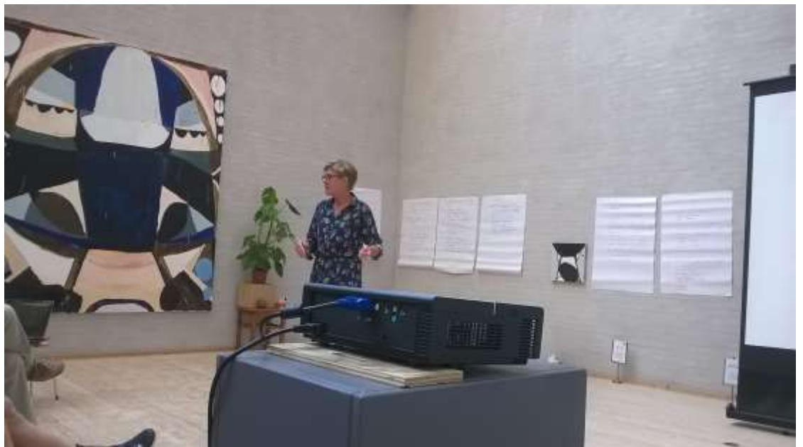
Inspirationsseminar for museumsansatte og frivillige