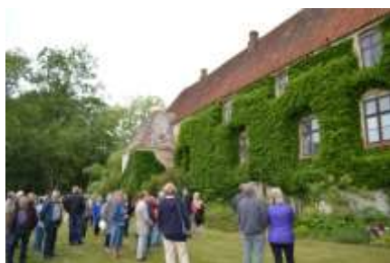
Lerkenfeldt Kulturarvsmåne- den 2016