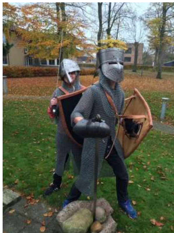
Riddere på Vesthimmerlands Museum

er der lavet interviews med lærere og elever; sidstnævnte i det omfang det har været muligt. Der ligger således et solidt kvantitativt datamateriale til grund for de konklusioner og anbefalinger, der bliver givet i best practice udgivelsen.