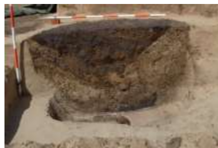
Den mulige brønd under genudgravning. Bemærk det oprindelige mørke lag i bunden af graven

rindelige position. Analyser af denne synes at vise, at der har stået vand på bunden, og at det centrale anlæg kan tolkes som oprindeligt værende en brønd, måske en hellig brønd, men under alle omstændigheder afsluttet som grav. En analyse viser, at der i aflejringerne findes rester af birkebeg, men det er for tidligt at udlede vigtige konklusioner af det. Pollenanalyse skulle gerne fortælle om, hvordan landet var bevokset og udnyttet, og gravlæggelsen skal dateres naturvidenskabeligt med C14. Endelig er det planen at lade det humane knoglemateriale undergå en måling af strontiummængden. Metoden kan måske være med til at afgøre om det er lokalt opvoksede personer, der var i graven, eller om det var udefrakommende, måske fra Wales?