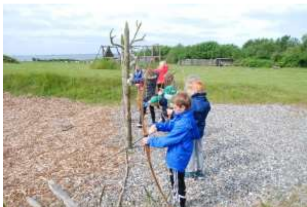
Bueskydning på Stenaldercenteret