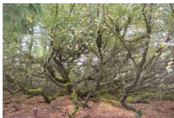
Ca. 250 år gammelt birketræ

Dato og mål er endnu ikke på plads, men annonceres snarest muligt via de elektroniske nyhedsbreve samt i dette blads efterårsudgave.