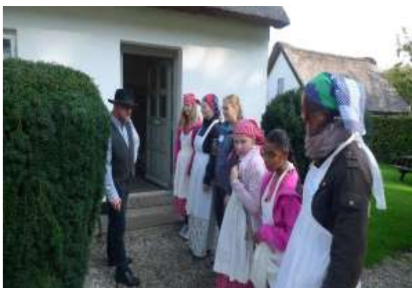
Skole på Hessel

Denne observation affødte nærværende projekt, hvor seks museer: Museum Amager , Storm P. Museet , Museum Sønderjylland – Sønderborg Slot , Ringkøbing-Skjern Museum , Gammel Estrup – Herregårdsmuseet og Vesthimmerlands Museum i perioden 2014-2016 har arbejdet målrettet og systematisk med udvikling af undervisningsforløb for børn med særlige behov. Den Gamle By , der siden 2011 har arbejdet med denne type museumsundervisning, har deltaget i en rådgivnings- og konsulentfunktion.