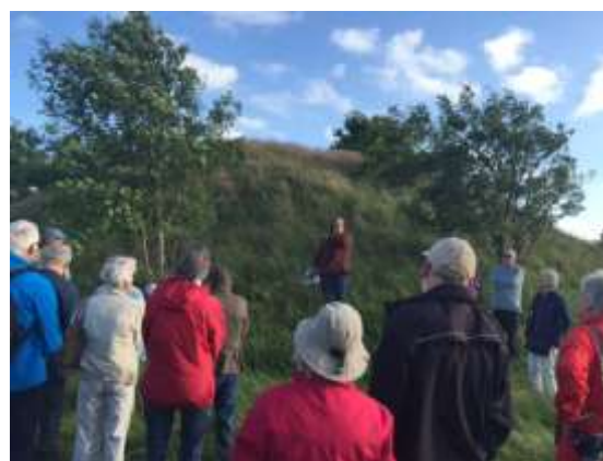
Voldstedet, Louns, juni 2016