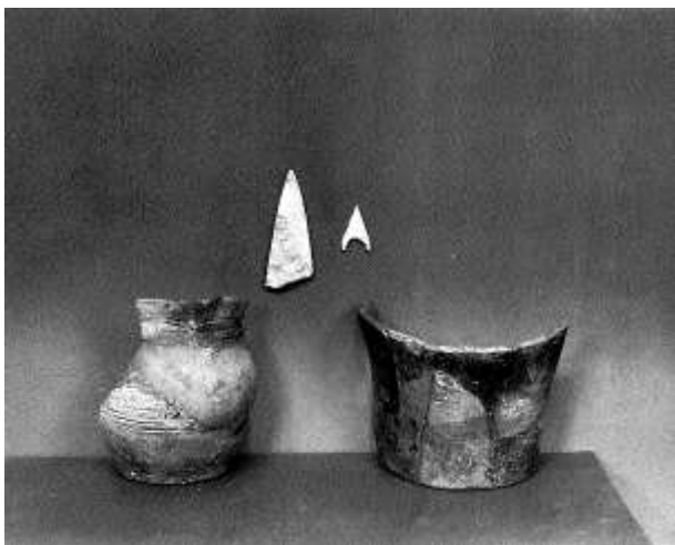
Fund fra udgravningen i 1934

Som en del af arbejdet med omfartsvejen syd om Aars dukkede der i sommeren 2016 en gammel kending frem: Stenildgårdgraven. Anlægget blev første gang undersøgt i 1934 og blev da beskrevet som Danmarks ældste brandgrav. Det viste sig dog under udgravningen, at der var mere til dette anlæg end blot en brandgrav.